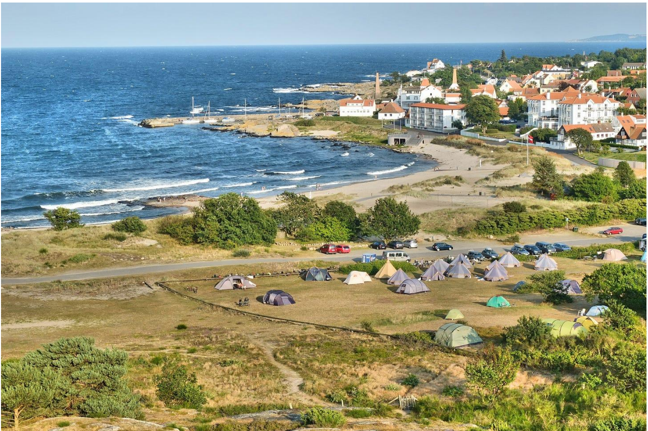
Den norske flåde var hurtige til at finde det rigtige sted, på det lave vand et par kilometer fra Danmarks Bornholm . . ."

Agenturets arbejdsgruppemedlemmer havde ingen direkte kontakt med Det Hvide Hus og var ivrige efter at finde ud af, om præsidenten mente, hvad han havde sagt – det vil sige, om missionen nu var en realitet. Kilden huskede: "Bill Burns kommer tilbage og siger: 'Gør det'."