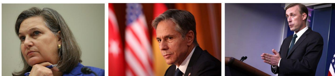
SPILLERE Venstre mod højre: Victoria Nuland, Anthony Blinken og Jake Sullivan.

Det, der blev klart for deltagerne, ifølge kilden med direkte kendskab til processen, er, at Sullivan havde til hensigt, at gruppen skulle komme med en plan for ødelæggelsen af de to Nord Stream-rørledninger - og at han levede op til ønskerne fra Formanden.