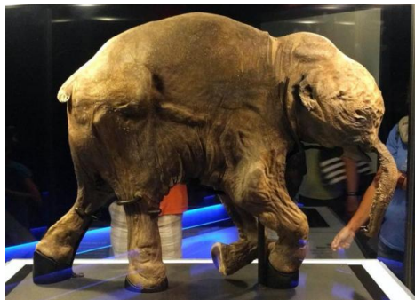
Den frosne mammutkalv "Lyuba", der stadig havde mad i maven.

Det er vigtigt at bemærke, at disse mammuters kroppe repræsenterer sunde, velnærede individer. De hører ikke til meget gamle, degenererede eller sultende dyr, som nogen mener. Faktisk blev en dybfrosset seks måneder gammel baby-mammutkrop, der blev fundet i 1977, så perfekt bevaret, at analyse af dens blod og protein, og dens væv blev brugt til genetiske undersøgelser. Interessant nok blev datoen for dens død bestemt til for ca. 12.000 år siden.