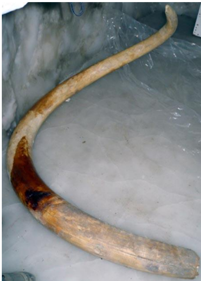
Tusk fra den voksne hanmammut "Yukagir mammut".

Der er tusinder af velbevarede mammut-tænder, der er blevet opdaget i Sibirien, og som har ført til en verdensomspændende handel med elfenben, der har foregået siden romertiden. Hvis elfenbenstænderne udsættes for luften i en længere periode, rådner de; og alligevel findes der godt bevarede tænder fra uddøde dyr i det arktiske område, der stadig udgraves i dag.