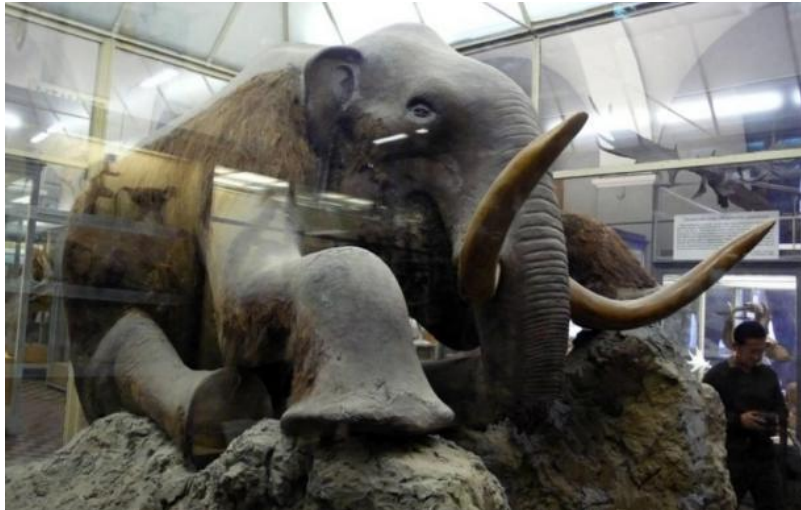
Beresovka-mammuten, bortset fra hoved, er det en næsten fuldt konserveret, mumificeret mammutkroppe, der blev opdaget i Sibirien.

Det frøs jordbunden til is, forvandlede søen og grundvandet til store islinser og frøs døde og døende dyr og planter i hele regionen til dystre mindesmærker, der uændret har overlevet i denne tilstand ned til vore dage. Blandt disse har været frosne kroppe af pattedyr, uldne næsehorn og andre store pattedyr.