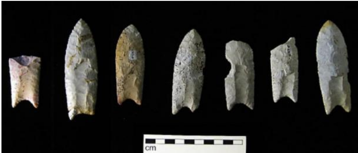
Clovis peger fra Rummells-Maske Cache Site, Iowa.

indfødte i Nordamerika, var flere og mere avancerede i deres jagtmetoder. Det er teoretiseret, at de jagede mange store pattedyr, eller megafauna, til udryddelse. Deres jagt udgjorde overmord.