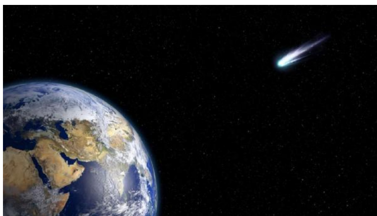
En stor nok komet kunne forårsage en katastrofe på Jorden.

Hancock antyder, at dele af Europa og det nordlige Sydamerika også blev påvirket. Dette kaldes den " Younger Dryas komet- påvirkningsteori ", der først blev foreslået i 2007, og siden har fået støtte fra nogle mainstream-forskere.