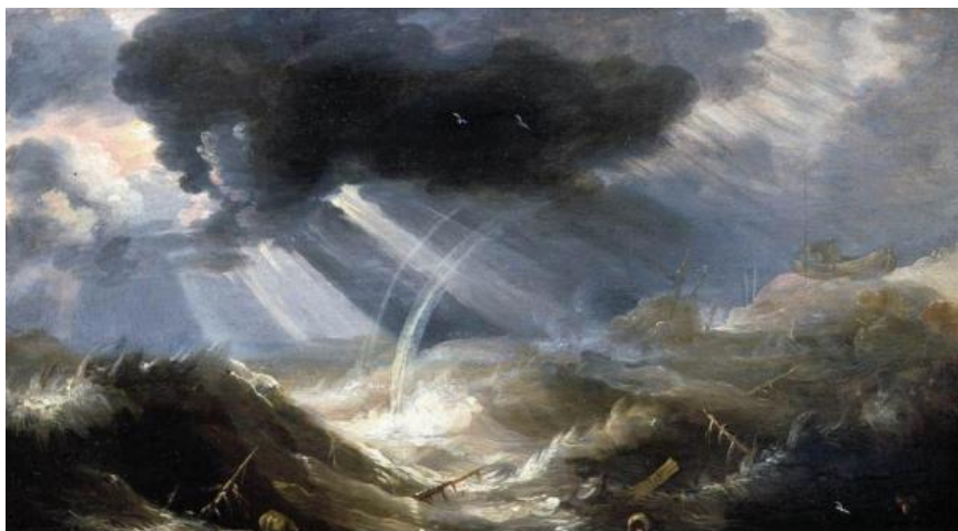
The Great Flood myten er en katastrofe, der er udbredt i mange kulturer over hele verden.

I slutningen af den sidste istid, bemærker mainstream-forskere, antages det, at ismeltingen har hævet havvandstanden med omkring 91 meter. Oversvømmelsesmyter fra hele verden beskriver karakteristisk scener, når mennesker og dyr flygter fra de stigende tidevand og finder tilflugt på bjergtoppene.